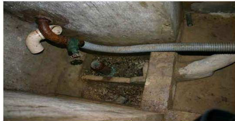
Le captage aval (point « B »), lieu du meilleur compromis de prélèvement entre accessibilité et « au plus près » de l'émergence.

Alternative : au réservoir, sous réserve d'installer un piquage à l'amont du traitement.