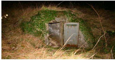
Le captage aval (point « B »)