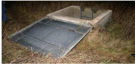
Le captage amont (point « A »)