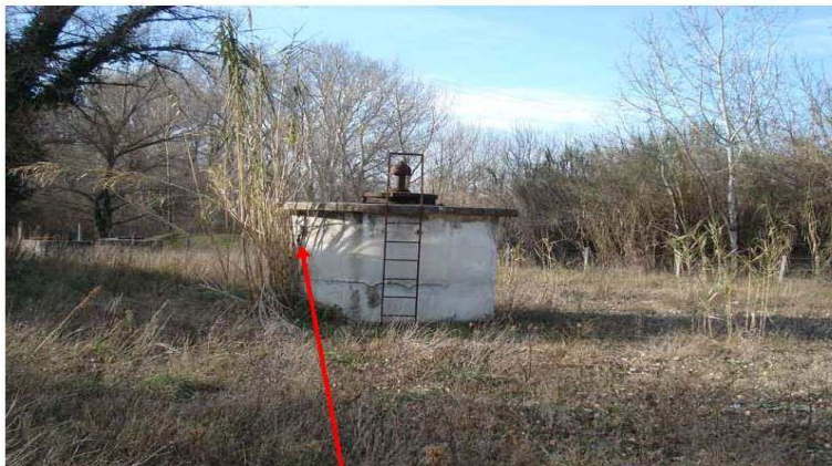
Robinet de prélèvement