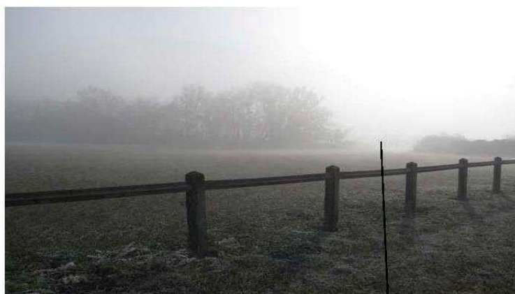
Accès au forage