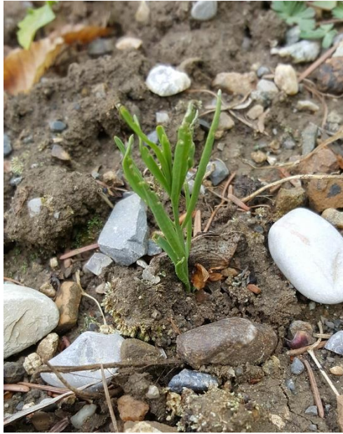
Figure 1 : pied de Thesium linophyllum produit à partir de stolons