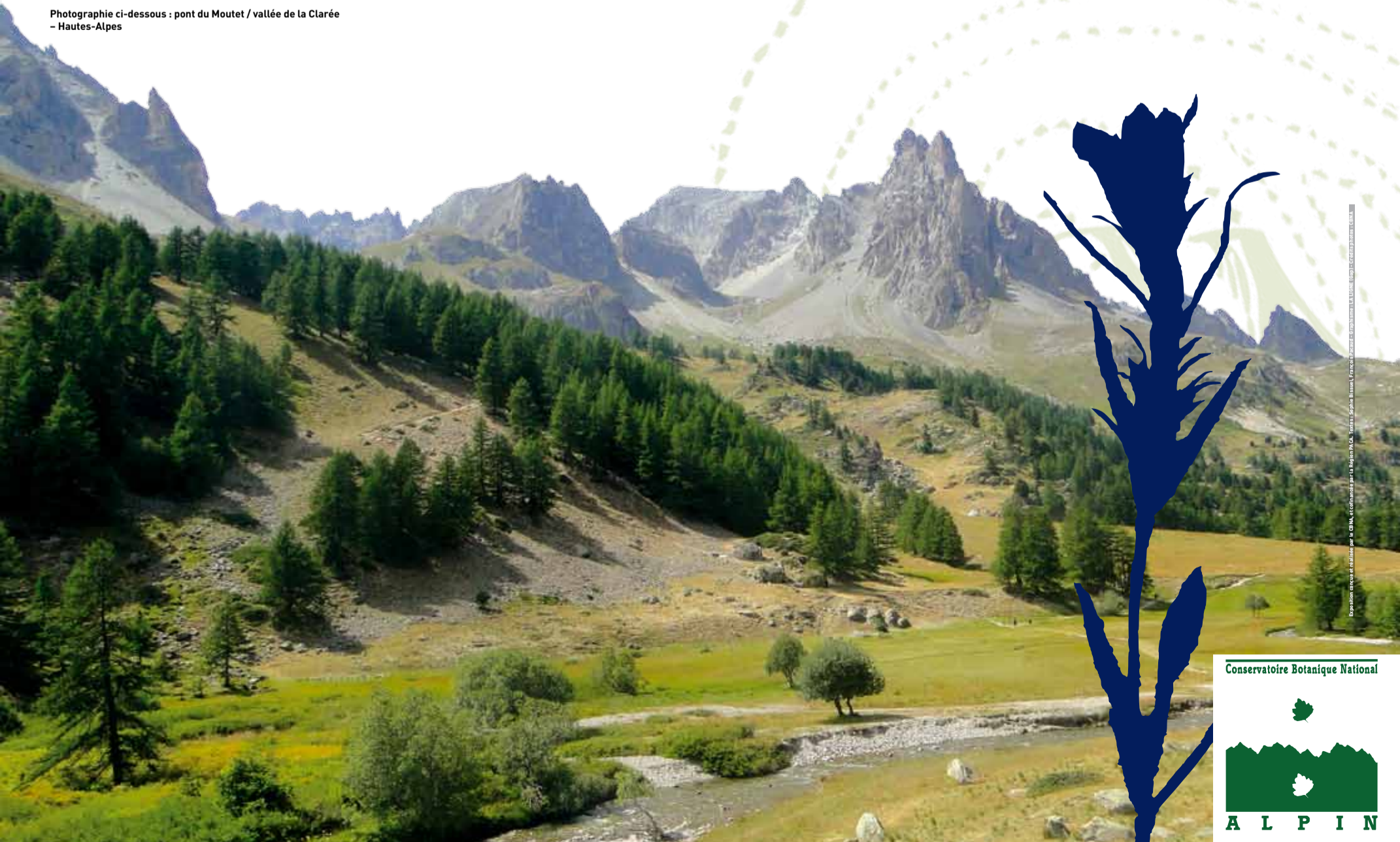
Photographie ci-dessous : pont du Moutet / vallée de la Clarée - Hautes-Alpes