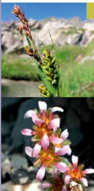
En haut : Laïche vulgaire/ Carex nigra , plante caractéristique des pelouses alpines En bas : Saxifrage à 2 fleurs/ Saxifraga biflora , typique des environnements rocheux

A l'échelle nationale, un programme de cartographie des habitats a été lancé. Il s'agit du dispositif CARHAB, dans lequel le CBNA est particulièrement impliqué.