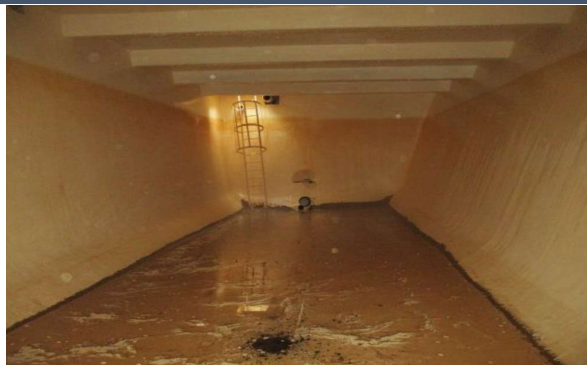
Photo du réservoir