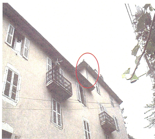
Un chéneau (photo 48 Henri IV) Adresse : n°48 Rue du Bain d' Henri IV