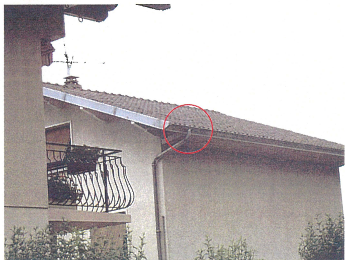
Un chêneau (photo46) Adresse : n°46 Route du Revard