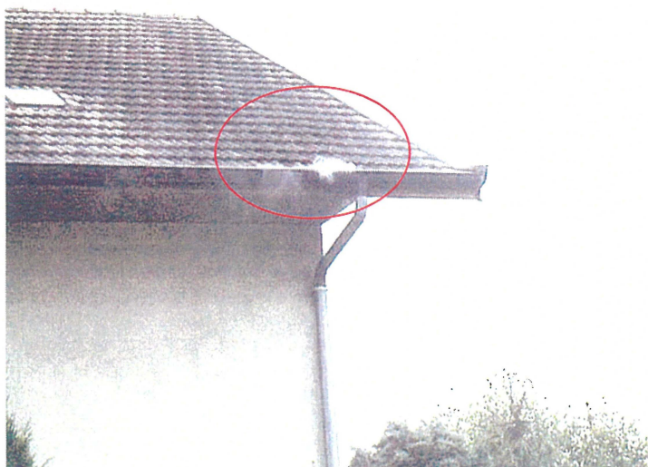
Un chéneau (Photo 68) Adresse : n°68 Chemin de Saint Pol