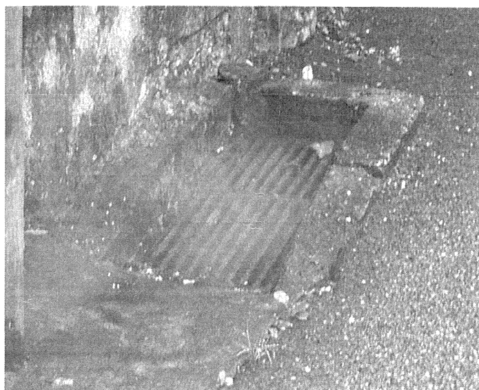
Grille pluviale (Photo A)