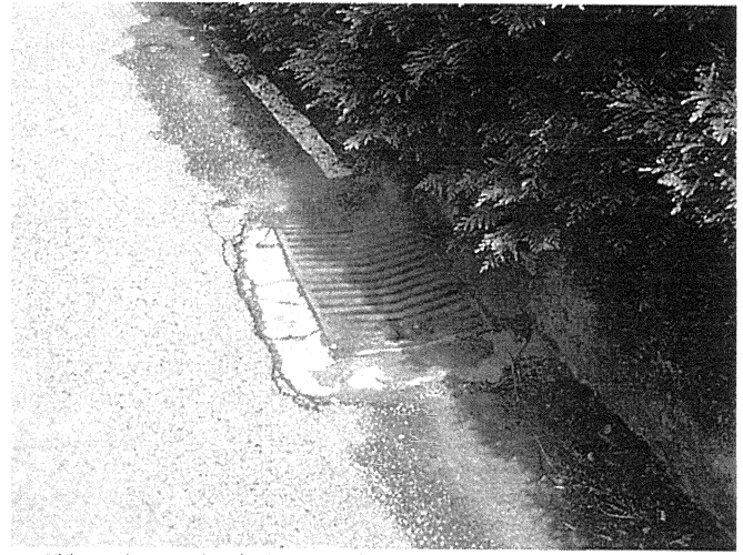
Grille pluviale (photo E)