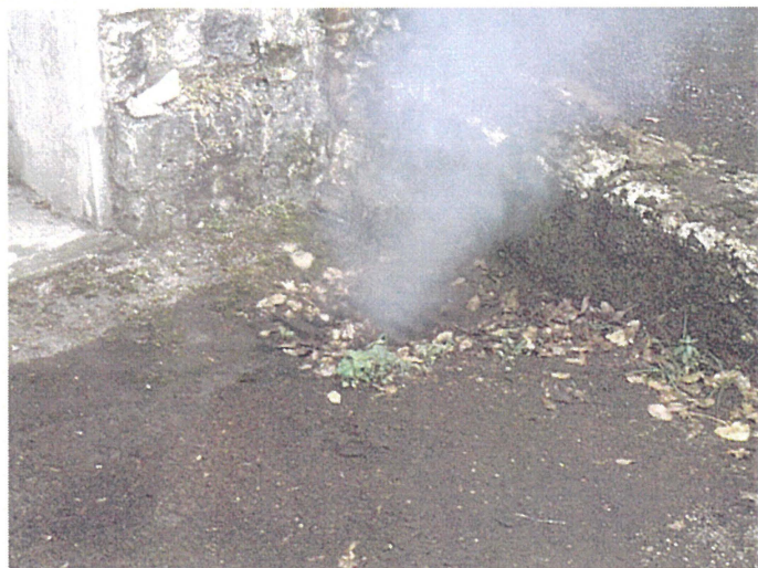
Une grille de sol (Photo 11) Adresse : n°11 Route du Revard