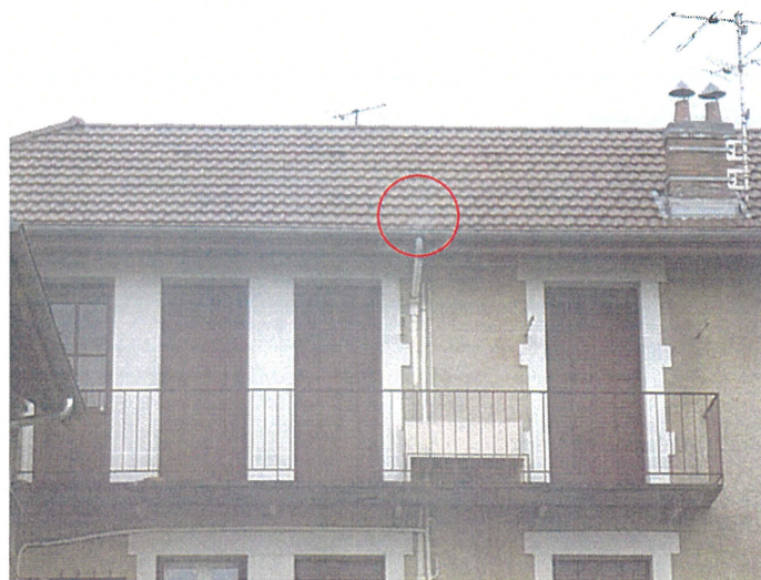
Un chêneau (photo 22) Adresse : n°22 Route du Revard