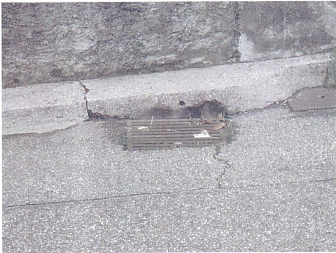
Une grille de chaussée (Photo Grille n°41) Adresse : n°41 Chemin de Saint Pol