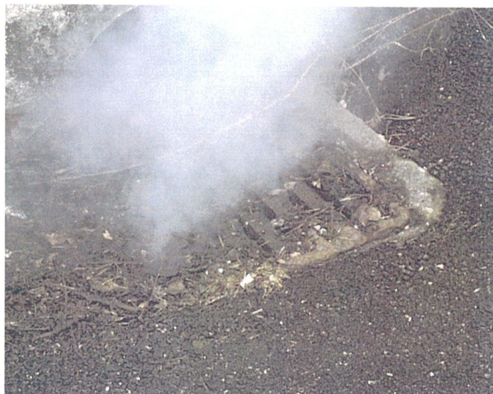
Une grille de chaussée (photo B)

Adresse : croisement du Chemin de Saint Pol et du Chemin de Notre Dame des Neiges