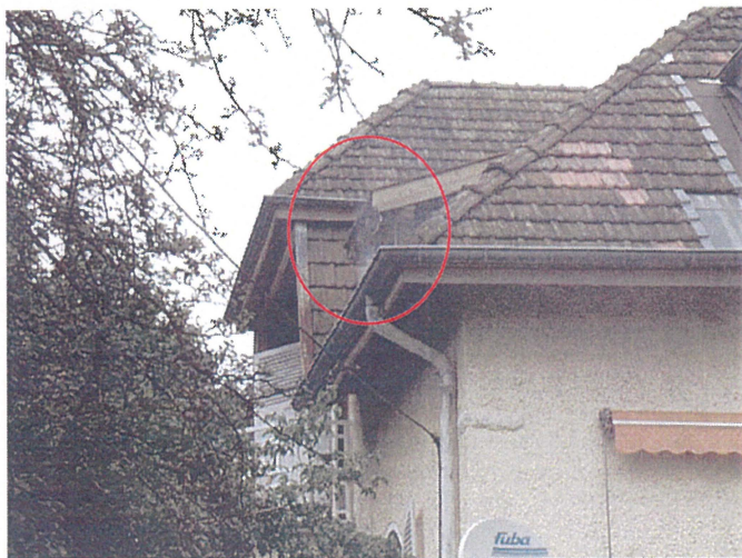
Un chéneaux (Photo 35) Adresse : n°35 Chemin de Saint Pol