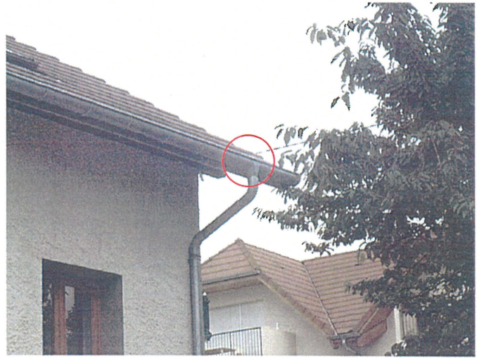
Un chéneaux (photo 41) Adresse : n°41 Chemin de Saint Pol