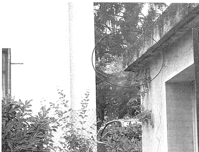
Un chéneau (photo 7) Adresse : n°7 Route de Pugny