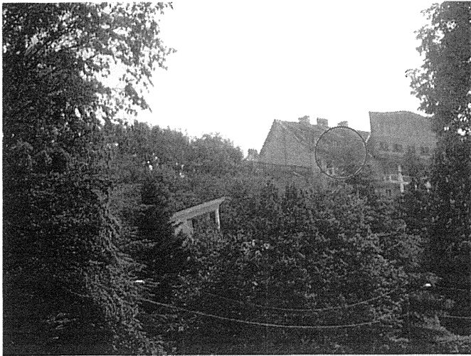
Un chéneaux (Photo G)