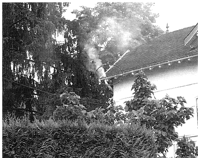
Un chéneau (Photo 6)