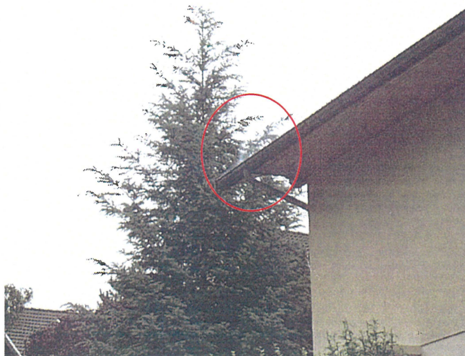
Un chêneau (photo 48) Adresse : n°48 Route du Revard