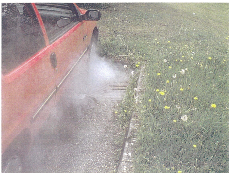
Trois grilles de chaussée (Photo F)

Adresse : croisement du Chemin de Saint Pol et du Chemin de Notre Dame des Neiges