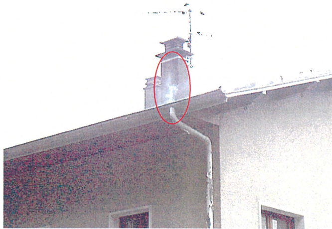
Un chéneau (photo 54) Adresse : n°54 Route du Revard