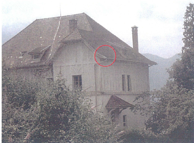
Un chéneau (Photo 14)