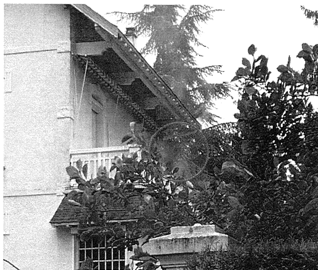
Un chéneau (Photo 6 bis)