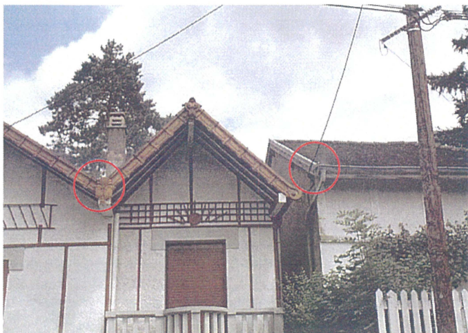
Trois chéneaux (Photo 70 (2) gauche)