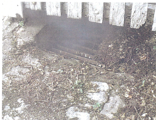
Grille pluviale (photo 70 (2))