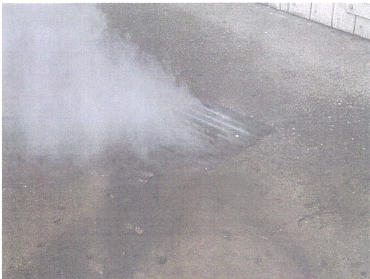
Une grille de chaussée (Photo C)

Adresse : croisement du Chemin de Saint Pol et du Chemin de Notre Dame des Neiges