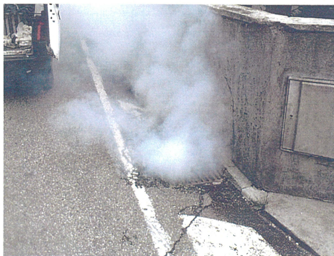
Une grille de chaussée (photo D) Adresse : croisement du Chemin de Saint Pol et du Chemin de Notre Dame des Neiges