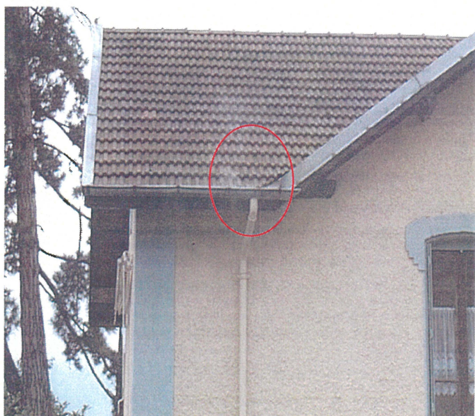
Un chéneau (Photo 55) Adresse : n°55 Rue du Bain d' Henri IV