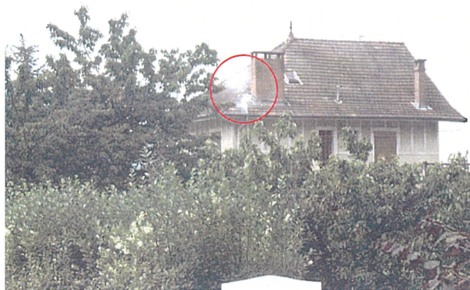
Un chéneau (Photo 53) Adresse : n°53 Chemin de Saint Pol