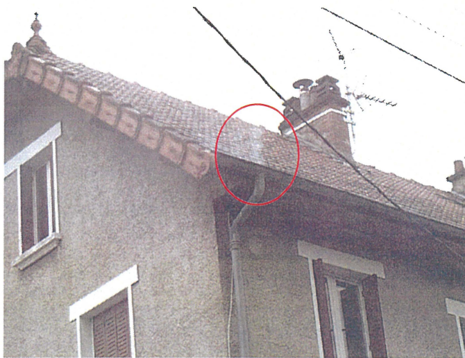
Un chéneau (photo 5) Adresse : n°5 Chemin de Chevaline