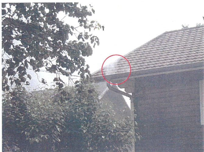
Un chéneau (Photo 72) Adresse : n°72 Chemin de Saint Pol