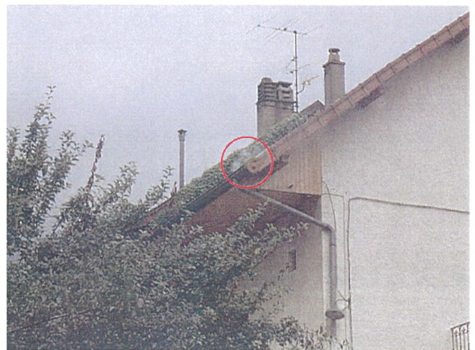
Un chéneaux (photo 31) Adresse : n°31 Chemin de Saint Pol