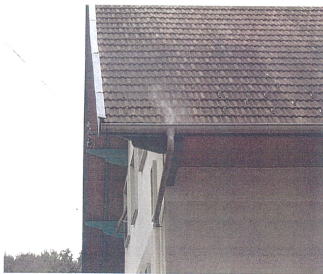
Un chéneaux (photo 36)