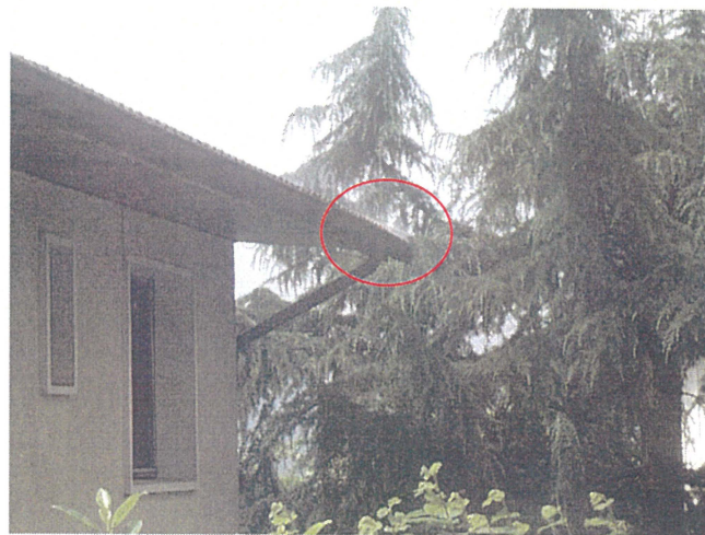
Un chéneaux (photo 15)