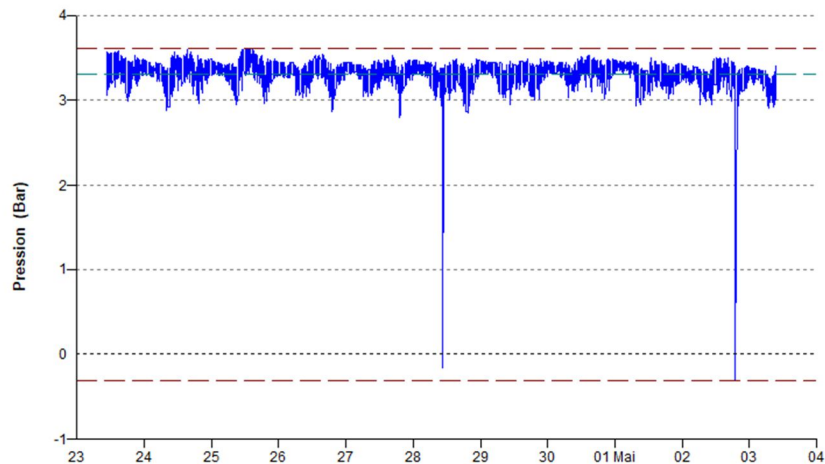
Mesure de pression - P9-PI00