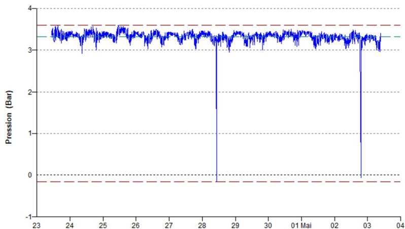
Mesure de pression - P9-PI00