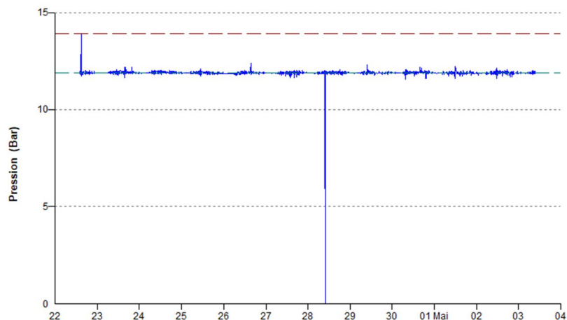
Mesure de pression - P6-PI20